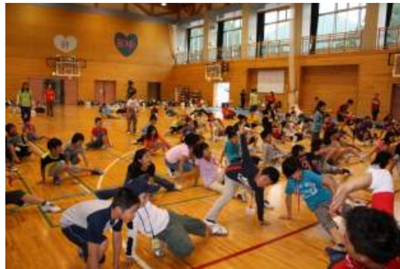
きめのポーズの練習