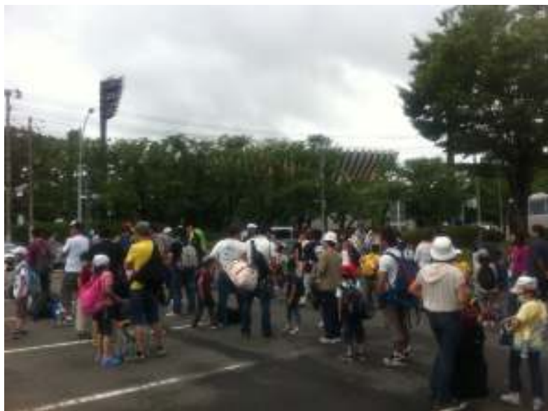
市役所駐車場にて集合