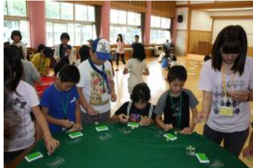
スタンプで飾りをつけます