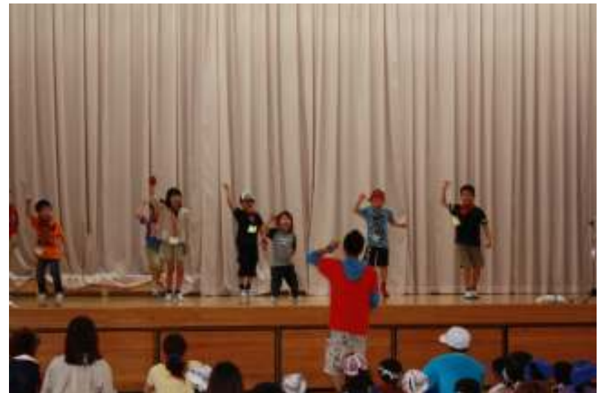
グループごとにステージで発表