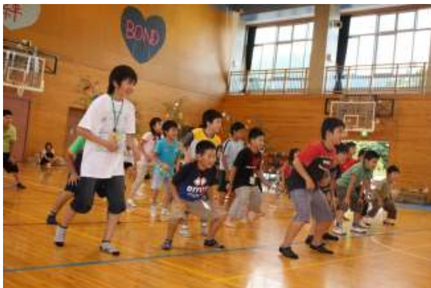
みんなカッコよく踊れてるね