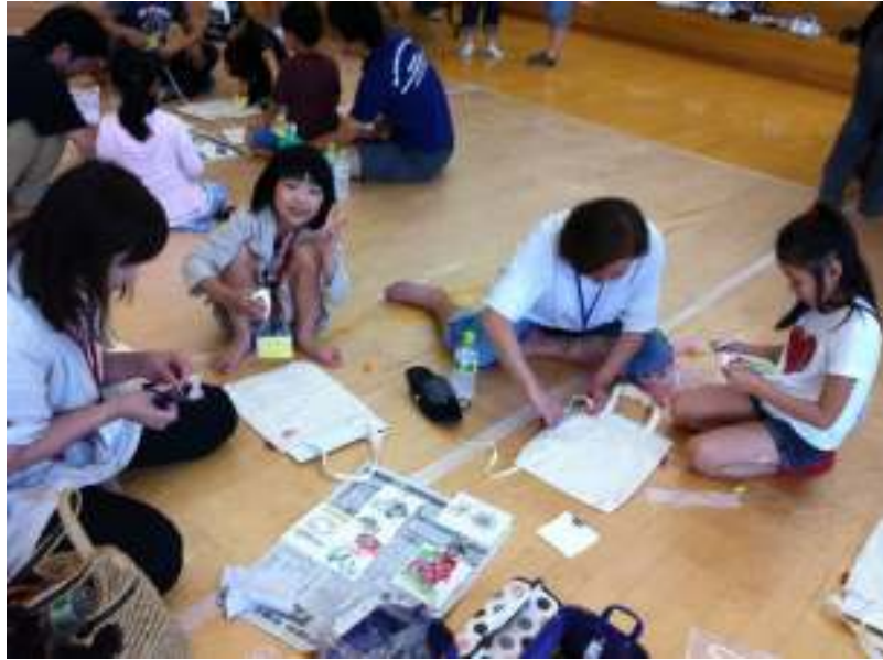
親子で思い思いのトートバッグ作り