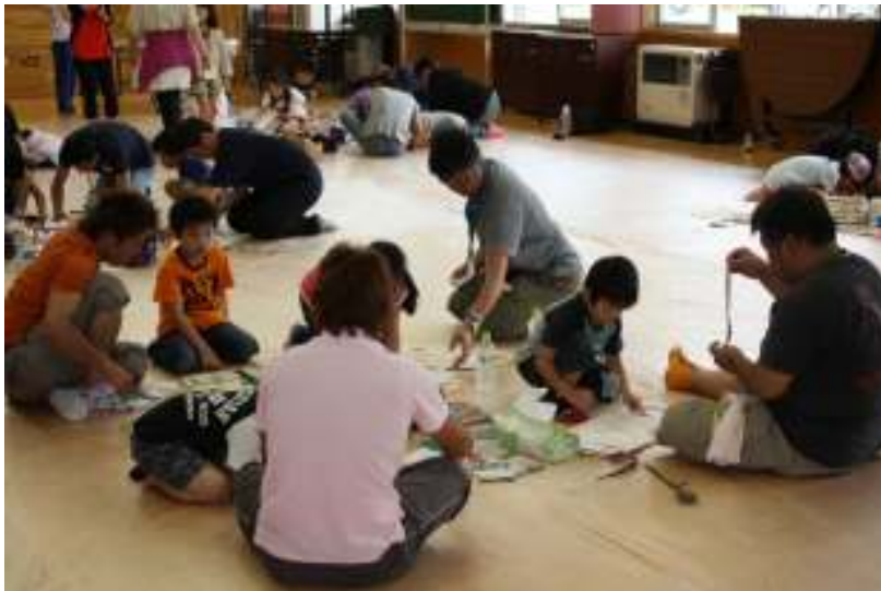
お父さんも真剣です