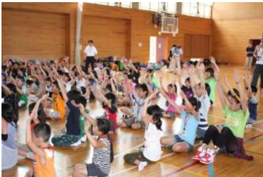
ダンスの前にウォームアップのゲーム