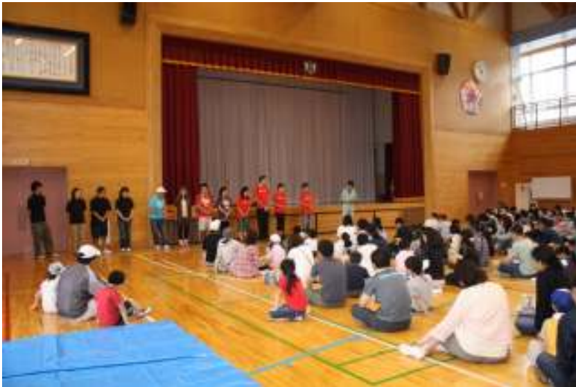
最初にサントリー様ご協力とスタッフ紹介