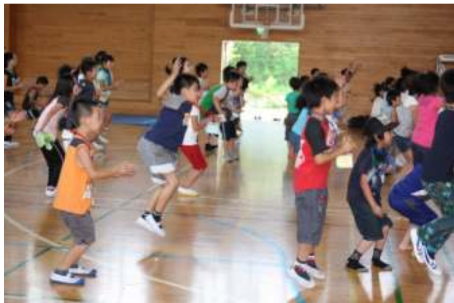
思いっきりジャンプ!