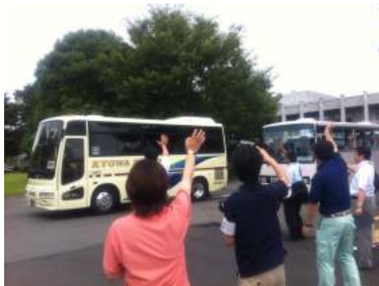
行ってらっしゃい!