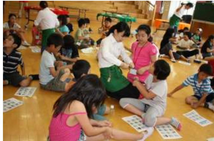
ネジを入れ込むのがちょっと堅いかな