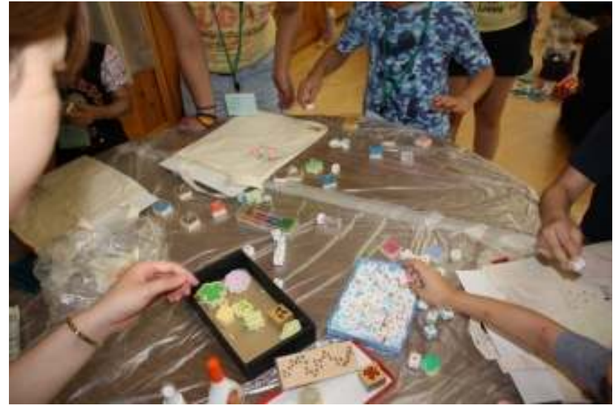
画材がたくさん、どれにしようかな