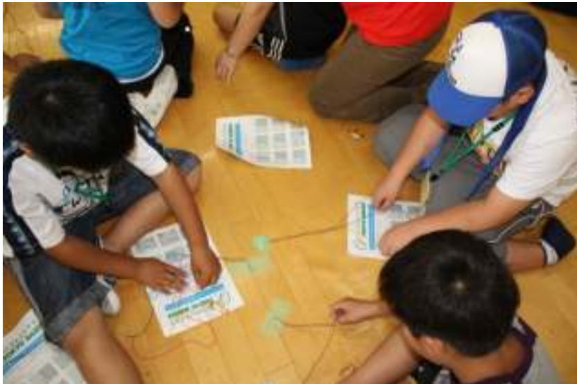
三つ編みはちょっと難しいなあ