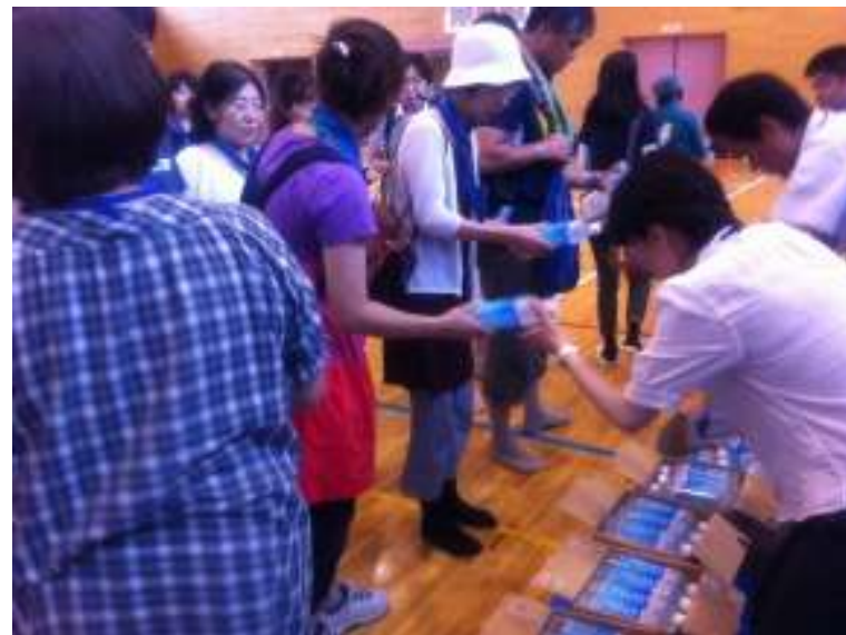
サントリー様 NATURALi配布