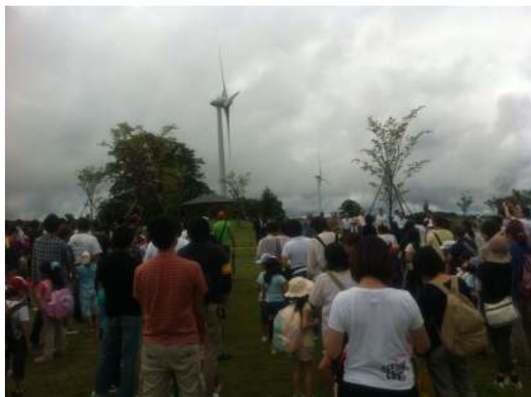
布引山にて開校式:市長挨拶