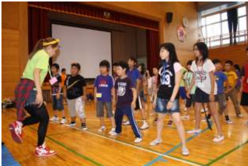
真剣にステップの練習