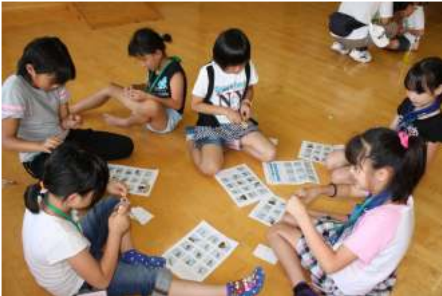
編んだヒモをネジに巻きつけます