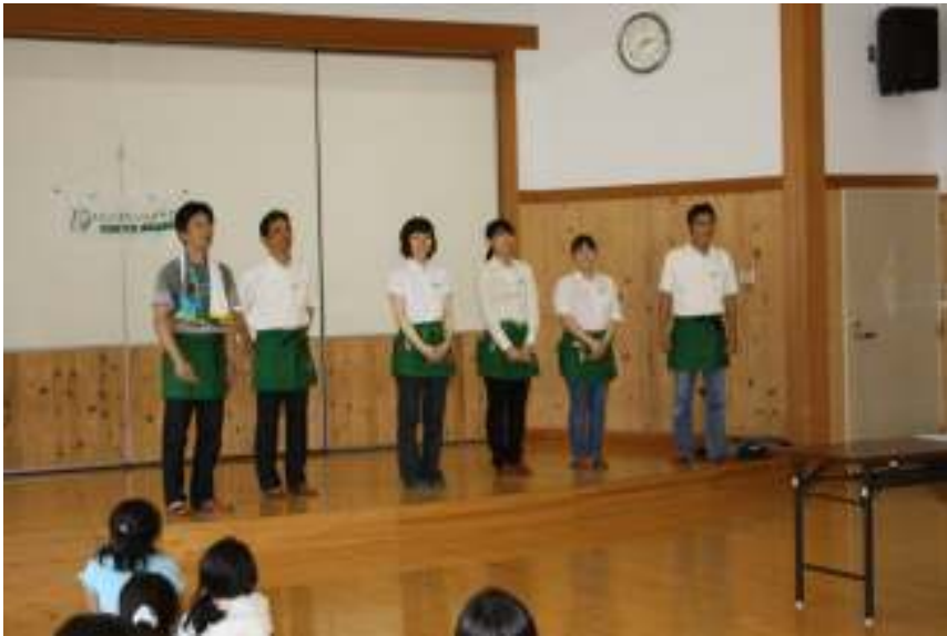
東急ハンズ・スタッフのみなさま