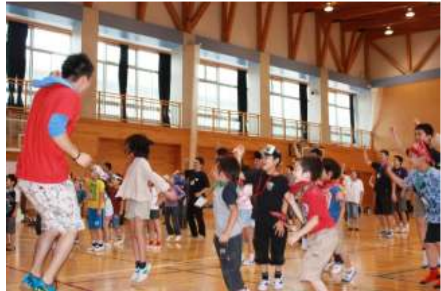
ダンスで子どもも大人もノリノリです