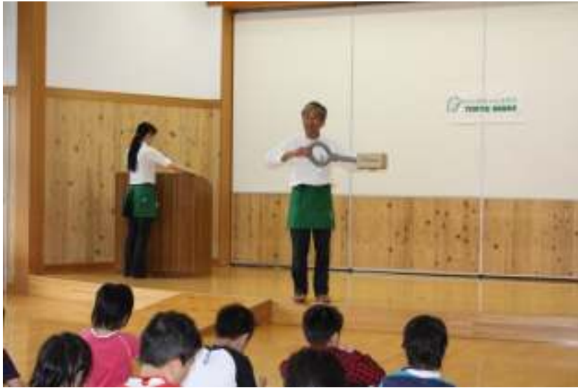
これからバードコールを作ります