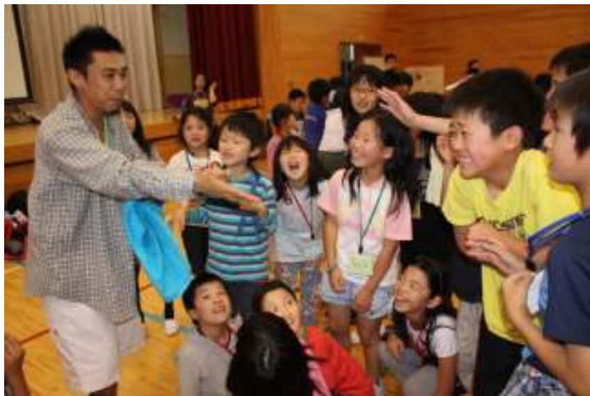
大人気のインストラクターさん