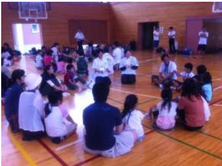
湖南小中学校へ移動、班分け