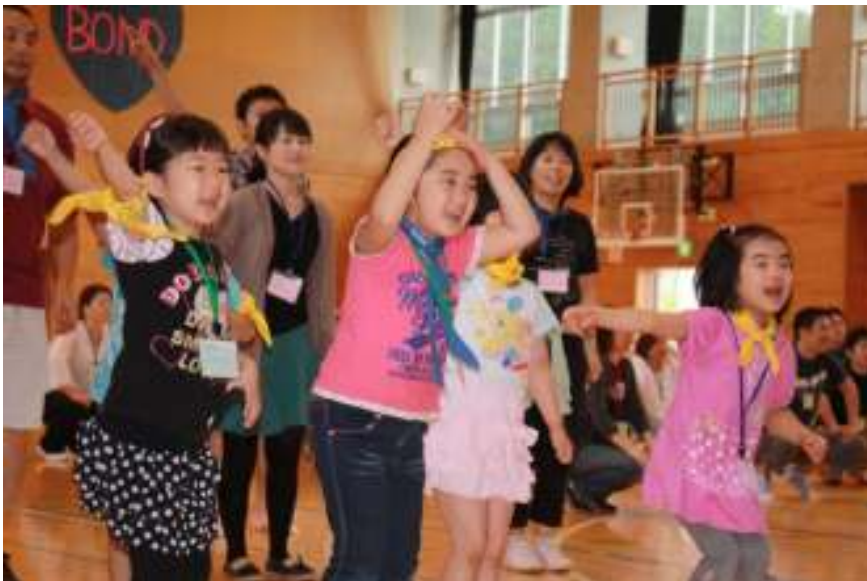
ミッキーマウス・マーチに合わせて踊りました